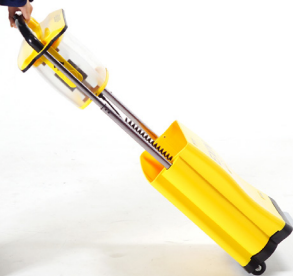
EXIN-ST Dreibein-Stativ / tripod